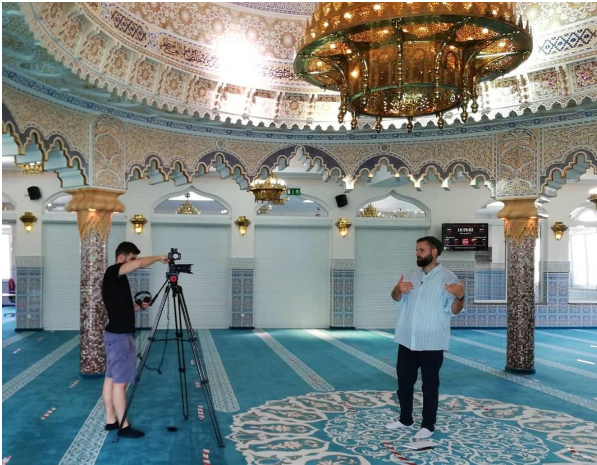
Videodreh in der Abu-Bakr-Moschee in Frankfurt-Hausen: eines von 11 Videos für den 4. Frankfurter Tag der Religionen „Religion und Natur“.